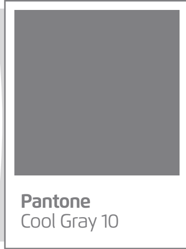
Pantone Cool Gray 10