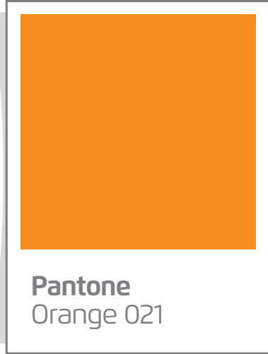
Pantone Orange 021

DKY İnşaat, DKY Otomotiv, DKY Sigorta ve İbrahim Dumankaya Holding markalarının yayın ve basın amaçlı tüm materyallerde kullanılan ana renklerin detayları aşağıda belirtilmiştir.